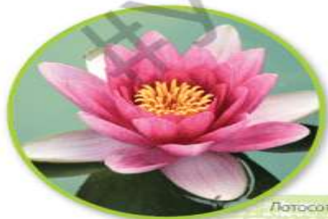
Лотосот расте во вода.

Семињата можат да преживеат без да изртат неколку години додека условите не станат поволни. Најстарото семе за кое се знае дека изртило било 1300 години старо семе од лотос пронајдено на дното на едно езеро во Кина.